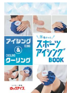
スポーツアイシング BOOK