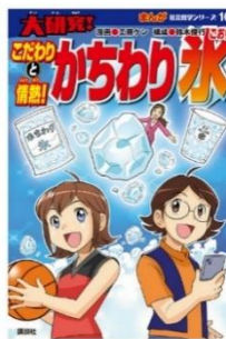
「こだわりと情熱！ かちわり氷」

KOKUBO グループは、ロックアイスの「冷やすチカラ」で社会貢献活動を実施しています。千葉県の中学校を対象とした交流授業の実施や全国の小学校への書籍の寄贈、また熱中症対策やスポーツアイシングを訴求する冊子の配布をしています。また八千代市内の小中学校・中学校にロックアイスの提供し、夏場の熱中症対策にご活用いただいています。