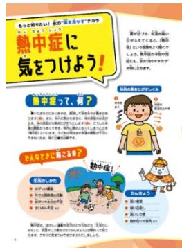
「氷の“冷やすチカラ”にドキドキ」

小久保製氷冷蔵株式会社（KOKUBO グループ、千葉県八千代市、代表取締役社長：酒井東洋士、以下小久保製氷）は、教育分野における地域・社会貢献を目的に、2026年6月より東京・大阪など小学校4・5・6年生の児童を対象に小学校副教材「未来クリエイター氷の“冷やすチカラ”にドキドキ」を50,000部配布します。熱中症の正しい知識や対処法、またスポーツアイシングなど「氷」の活用術や身近にある氷の“冷やすチカラ”を知っていただき、生活に役立てていただける内容です。また「氷のキャラクター」コンテストを実施し、2026年10月以降に結果を発表します。