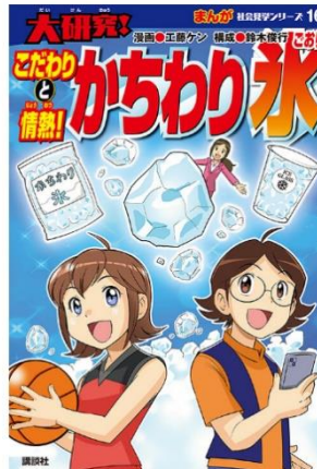
寄贈図書：「こだわりと情熱！ かわり氷」

KOKUBO グループは、ロックアイスの「冷やすチカラ」で社会貢献活動を実施しています。千葉県の中学校を対象とした交流授業の実施や全国の小学校への書籍の寄贈、また熱中症対策を啓発する冊子の配布をしています。また八千代市内の小学校・中学校にロックアイスを提供し、夏場の熱中症対策に活用頂いています。